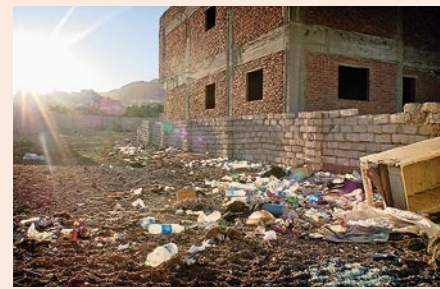
Eine Seite von Ägypten, die man in Werbebroschüren kaum sieht: Auf dem Weg in die Zukunft hat das Land noch viele Aufgaben vor sich

Weitere Gruppen treffen ein, zum Teil in Reisebussen. Tagesausflügler, die oft eine stundenlange Anfahrt zum Blue Hole in Kauf nehmen. »Die wollen dann nur noch eins: Schnell ins Wasser und sich abkühlen. Und denken nicht darüber nach, dass das