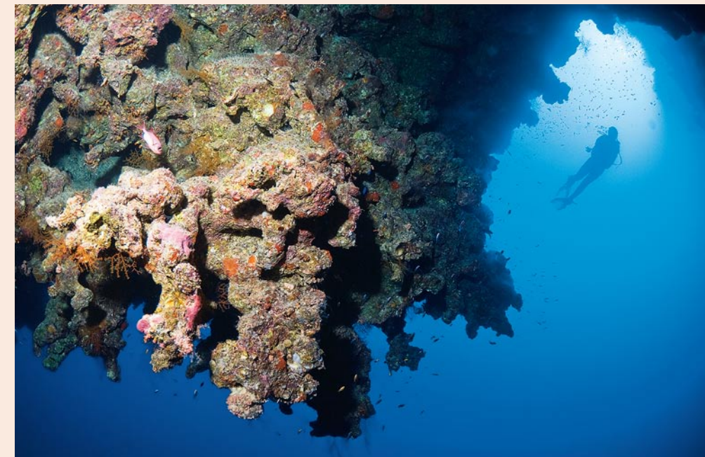
Verlockende Unterwelt: Magisches Blau und Jahrtausende alte Riffe – Ägyptens Kapital liegt unter Wasser. Doch noch längst ist nicht jeder sensibilisiert für nötige Umweltschutzmaßnahmen, beklagen Meeresbiologen

Etwa hundert Schritte entfernt liegt der Einstieg zu den »Bells«. Der Spot fällt bis auf acht Meter ab und verengt sich zu einem Kamin. Der röhrenförmige Einschnitt in der