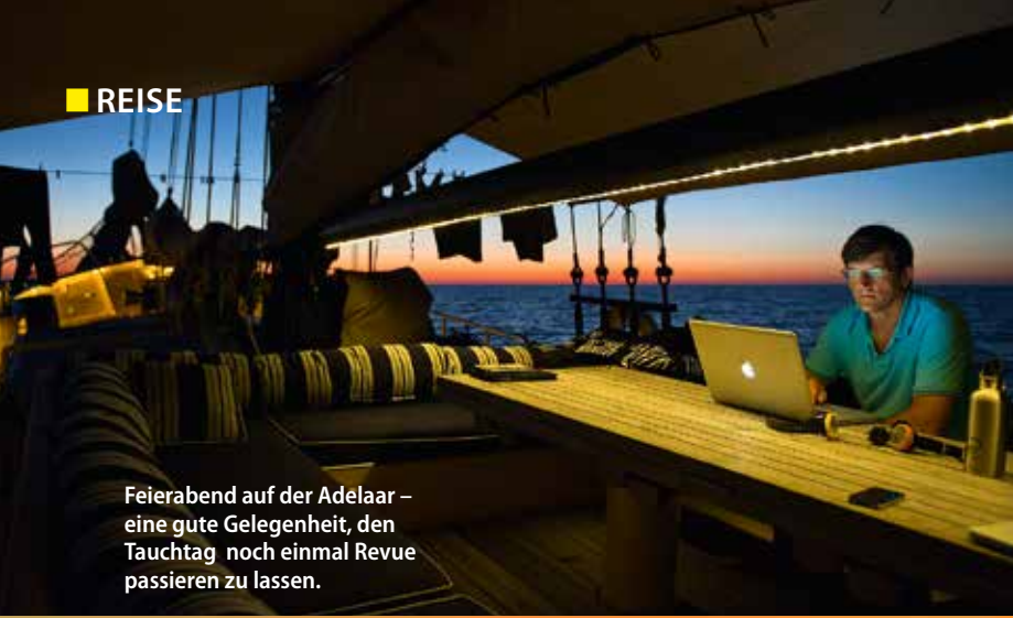
Feierabend auf der Adelaar – eine gute Gelegenheit, den Tauchtag noch einmal Revue passieren zu lassen.