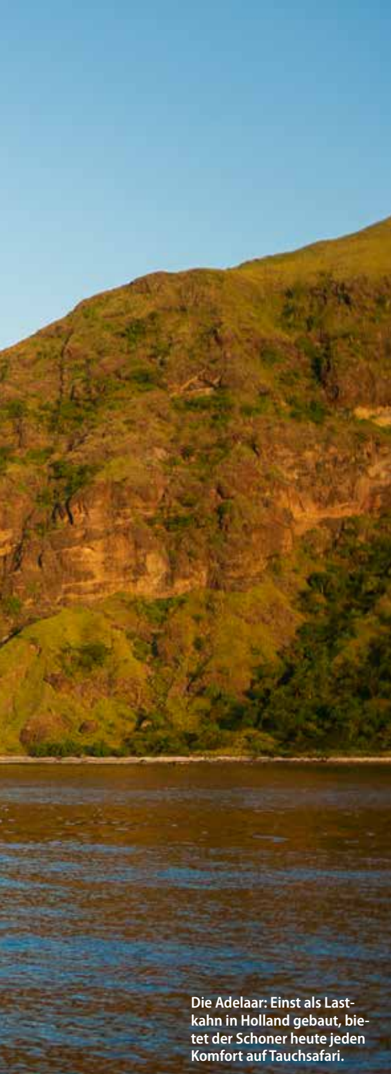
Die Adelaar: Einst als Lastkahn in Holland gebaut, bietet der Schoner heute jeden Komfort auf Tauchsafari.