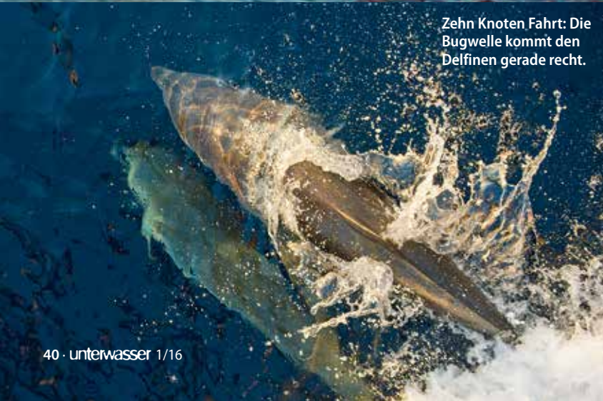
Zehn Knoten Fahrt: Die Bugwelle kommt den Delfinen gerade recht.