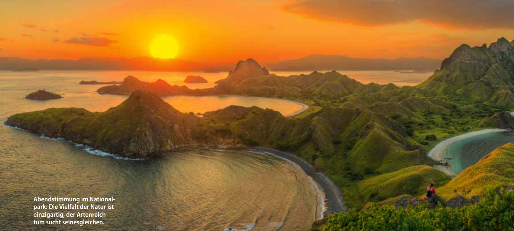
Abendstimmung im Nationalpark: Die Vielfalt der Natur ist einzigartig, der Artenreichtum sucht seinesgleichen.